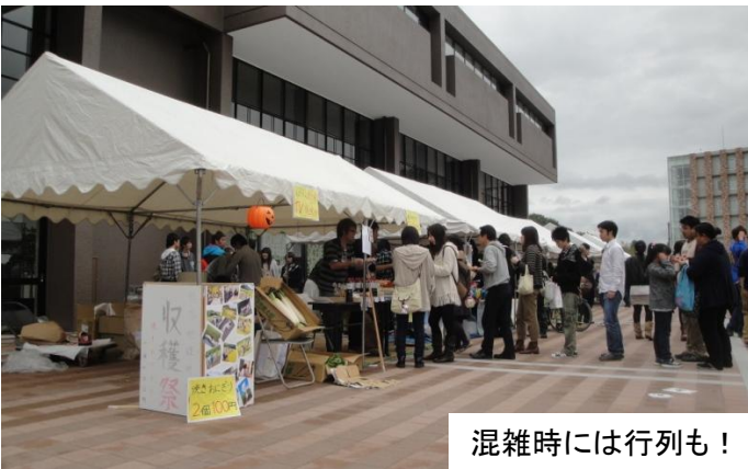
混雑時には行列も！