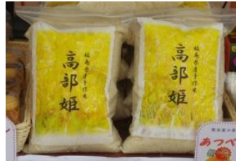
↑高部姫 焼きおにぎり↓

30日(土)は、あいにくの雨&台風接近でしたが、高部集落の方々、福島県地域振興課の方々、福島中央テレビの方々から来てくれました！テレビ取材や学生との交流、餅つき大会などを行いました。初めての米作り、大学祭への参加となりましたが、大成功となりました。